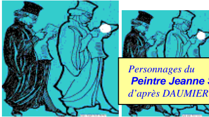
Personnages du Peintre Jeanne SOCQUET d'après DAUMIER